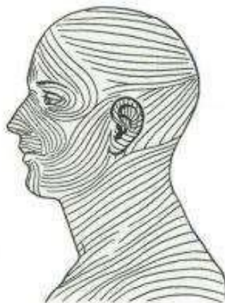
Рисунок 3. Условные линии натяжения кожи головы и шеи по С. R.Langer

Немецкий анатом С. R. Langer в 1861 году предложил разделять условные линии натяжения кожи, вдоль которых она максимально растяжима; направление линий при этом соответствует расположению пучков коллагеновых волокон (рис. 3).